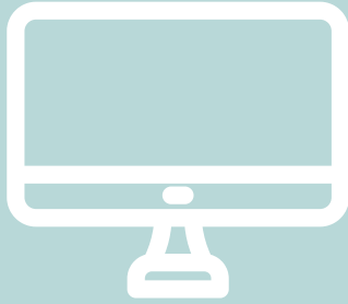
Computer met randapparatuur 33 euro/jaar