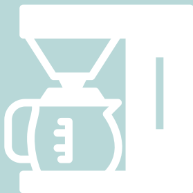
Koffiezetapparaat 6 euro/jaar