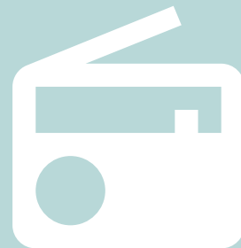
Hifi-installatie 6 euro/jaar