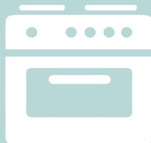
Oven met digitale klok 4 euro/jaar